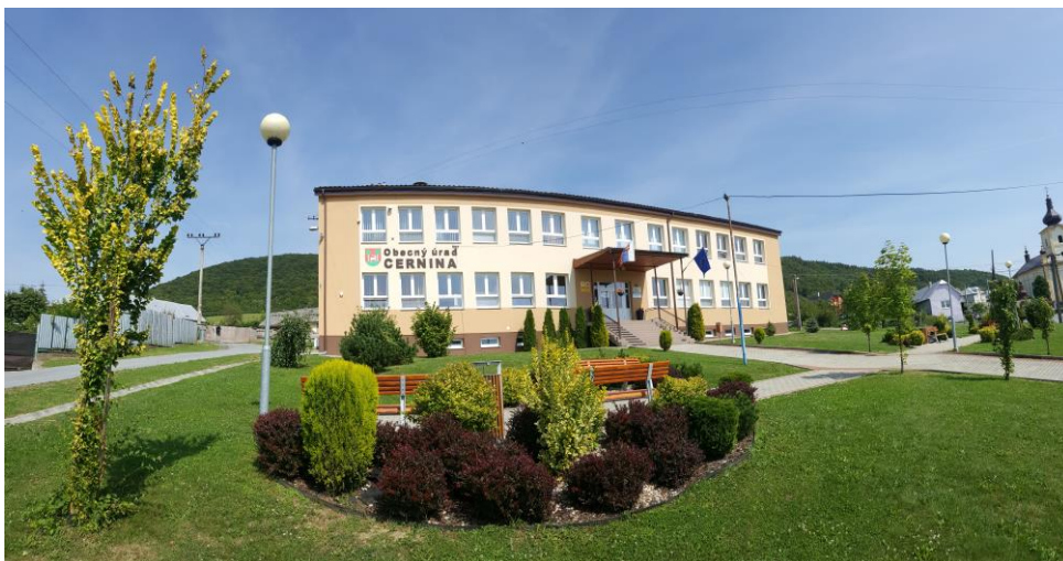
Obrázok č. 2 Budova obecného úradu Cernina

Prvá písomná zmienka o obci pochádza z roku 1414. Vznikla pravdepodobne na prelome 14. a 15. storočia. V Cernine bol objavený meč liptovského typu, ktorý pochádza z doby bronzovej (1900 – 700 rokov p.n.l.). Meč bol v roku 1906 odovzdaný do Šarišského múzea v Bardejove, kde sa zachoval dodnes. Obec Cernina existovala už pre rok 1352. Vpády poľských vojsk v roku 1491 – 1492 spustošili celé makovické panstvo. Zničená bola aj Cernina, čo potvrdzuje skutočnosť, že v obci bolo len 5 domácností a po šiestich zostali len opustené domy. Väčšina prv obrábaných polí zostala opustená. V roku 1492 sa v obci spomína murovaný kostol s drevenou vežou a fungujúci mlyn. Prílevom rusínskych prisťahovalcov v polovici 16. storočia sa pôvodný slovenský element stal menšinou a postupne splynul s novými obyvateľmi. V roku 1600 bolo v obci 32 poddanských domov, domy šoltýskych rodín, kostol a fara. Obec až do zrušenia poddanstva bola nepretržite súčasťou hradeného panstva Makovica. V roku 1787 stálo v obci 80 domov so 480 obyvateľmi, v roku 1828 už bolo 89 domov a 637 obyvateľov. Cernina patrila medzi najväčšie obce na okolí. V polovici 19. storočia postihla Šariš niekoľkoročná neúroda s následným hladom. Táto katastrofa neobišla ani Cerninu. Hlad spôsobil početné vysťahovalectvo a úbytok obyvateľov.