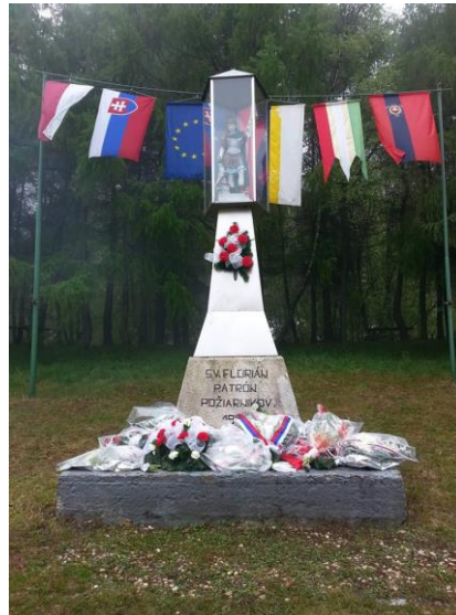
Obrázok č. 4 Socha svätého Floriána na hore Makovica

družina, ktorá si pri Makovici (u tzv. Čiernej studni) ukrývala nazbýjaný lup. Cez makovické sedlo viedla obchodná cesta a práve v ňom bola postavená krčma, ktorá fungovala ešte začiatkom minulého storočia.