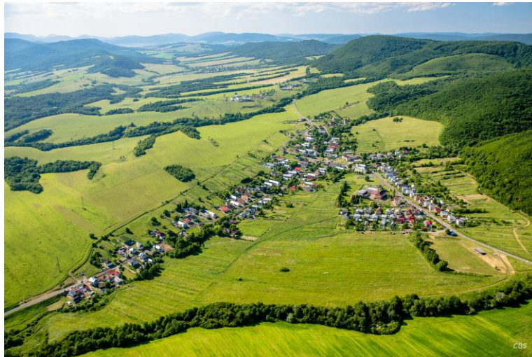
Obrázok č. 1 Obec Cernina