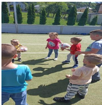
Obrázok č. 6 Pohybom k zdraviu a jesenné tvorenie v prírode