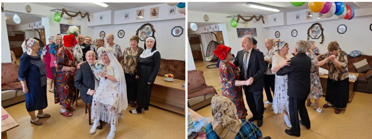
Obrázok č. 10 Karneval v Dennom stacionári CERNINA

Aj počas roka 2023 zamestnanci stacionára organizovali pre svojich klientov hranie spoločenských hier ako Šachy, Človeče - nehnevaj sa!, Karty a pod. Klienti sa ich zúčastňovali veľmi radi, čím vyplňali svoj voľný čas.