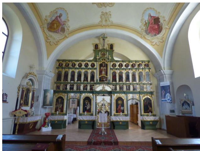
Obrázok č. 5 Časť interiéru gréckokatolíckeho kostola v Cernine

Typárium z roku 1868 vložené v zbierke pečatidiel Šarišského múzea v Bardejove